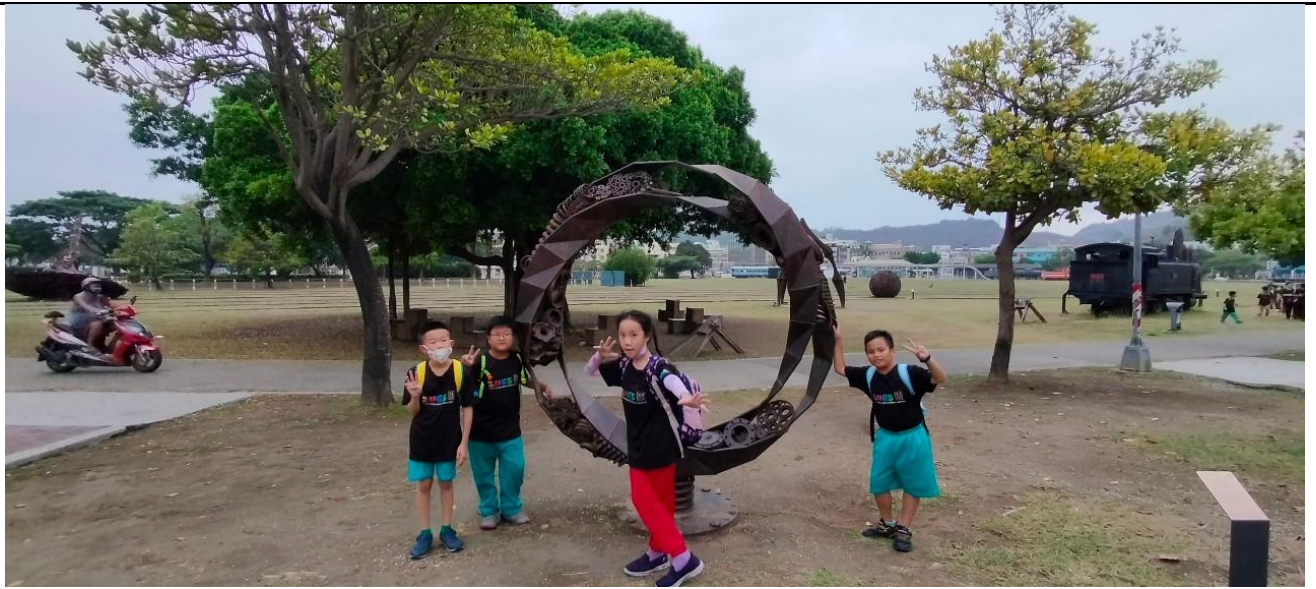
說明：觀賞駁二園區中的裝置藝術並合影留念