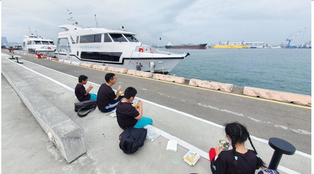
說明：下船後的午餐時間，吃著便當，欣賞著高雄港的美麗