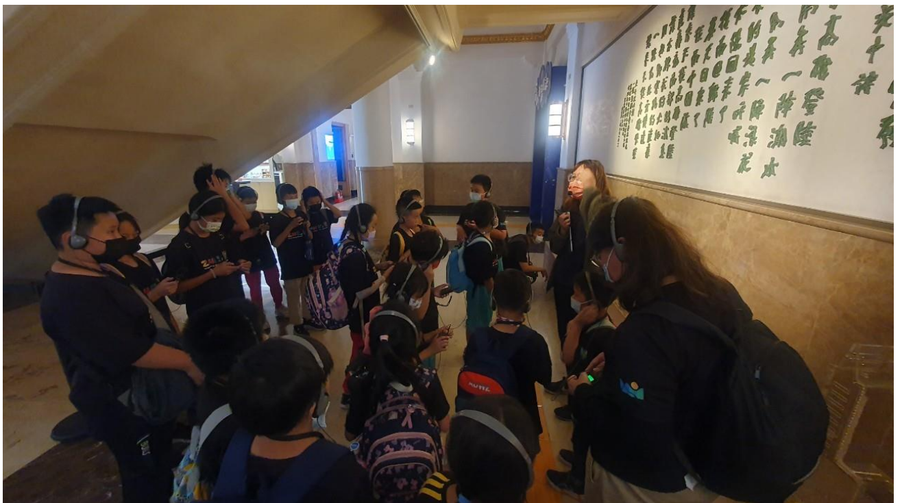
說明：到達歷史博物館，聽導覽員說明參觀訊息。