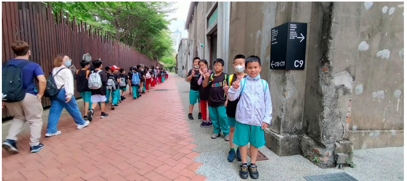
說明：參觀駁二倉庫群留下的歷史痕跡與新創再生面貌