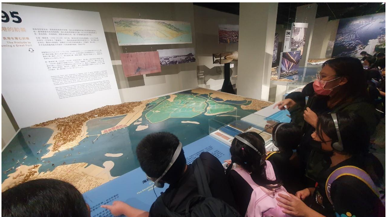
說明：導覽員介紹高雄港區的發展史，透過 3D 模型的俯瞰視角更清楚明瞭。