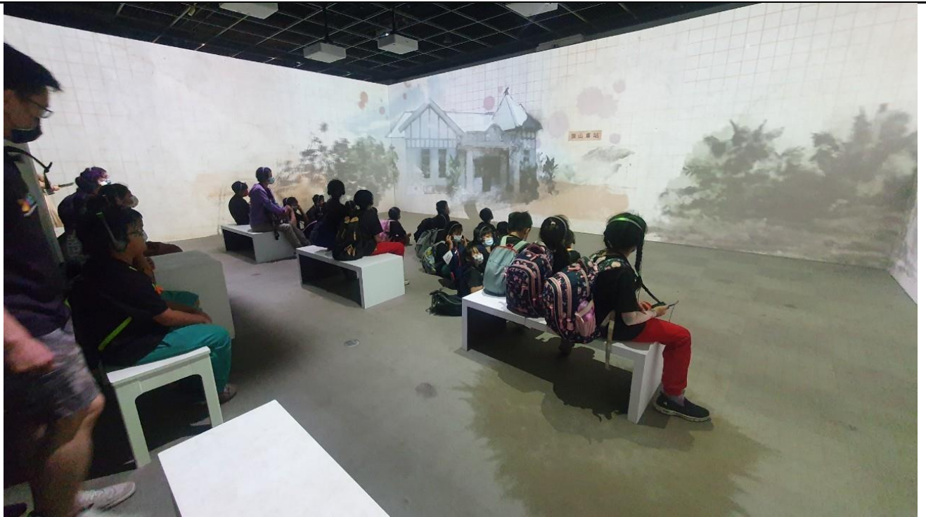
說明：觀賞製做成 2D 全景的高雄發展史動畫影片，很有貼近感。