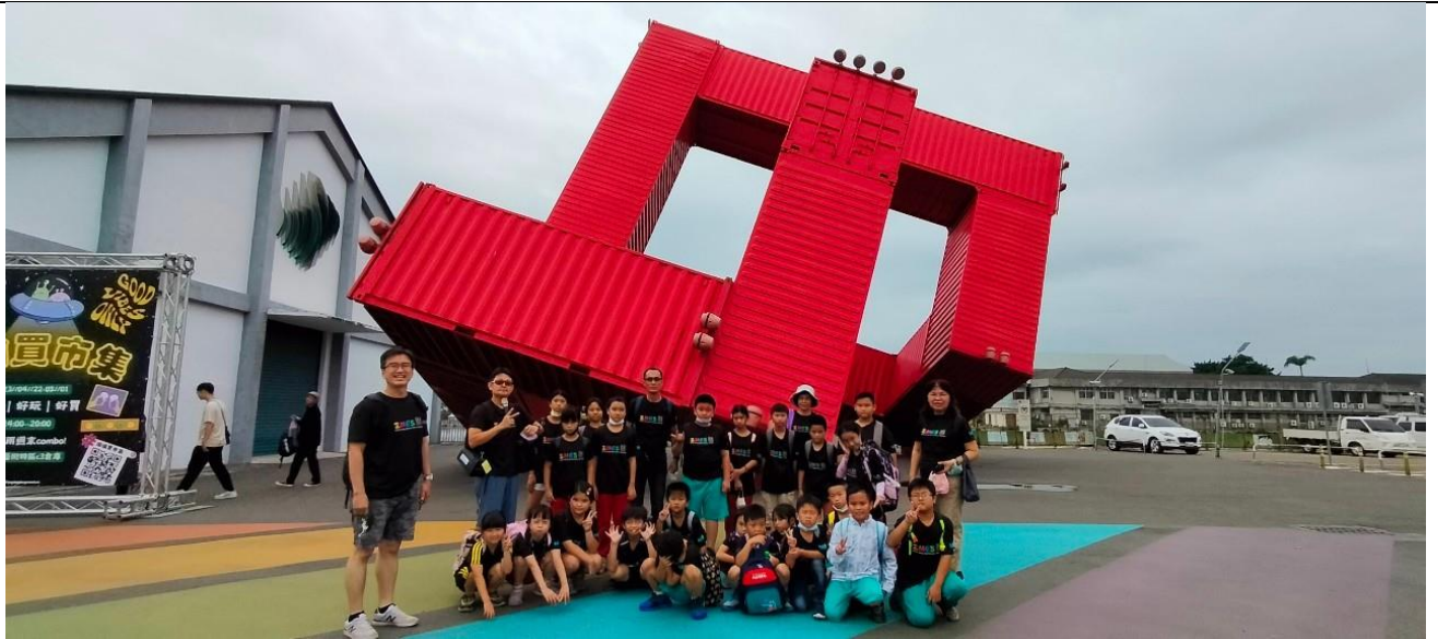
說明：觀賞駁二的地標 - 「巨人的積木」並合影留念