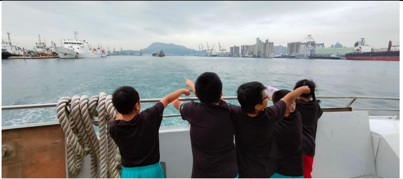
說明：站上甲板觀賞認識高雄港的各種船隻