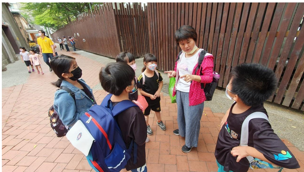
說明：導師向學生講解駁二大義倉庫的歷史