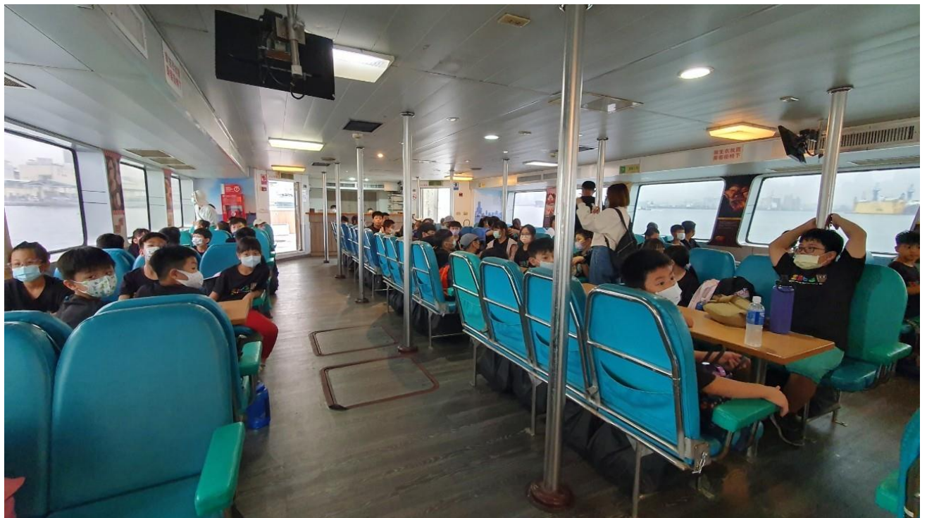
說明：於船艙內就坐，並聽從導覽人員的講解，準備出航！