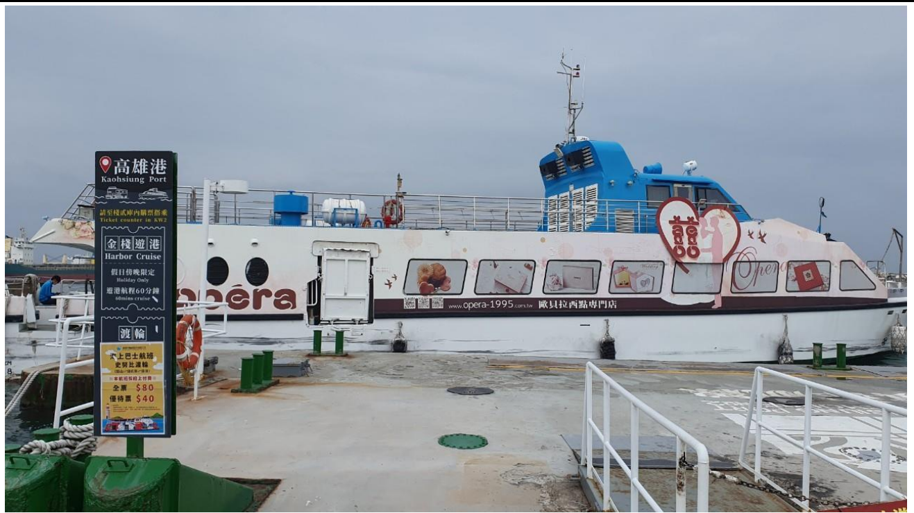
說明：於棧貳庫碼頭搭乘遊港輪