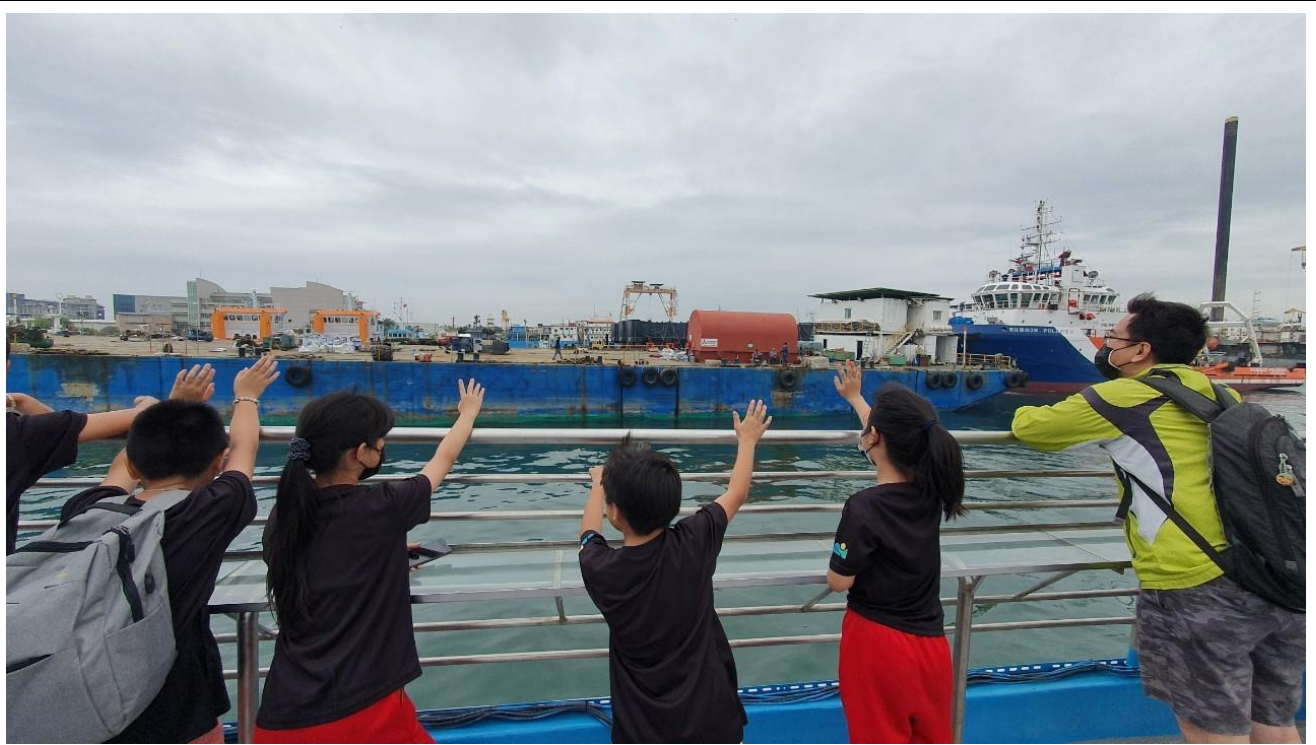
說明：與岸邊的船隻工作人員揮手 say : HELLO!